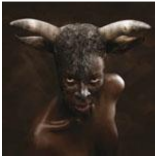
Female Power MMKA