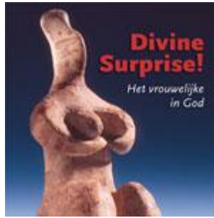
Divine Surprise FemArtMuseum in het Bijbels